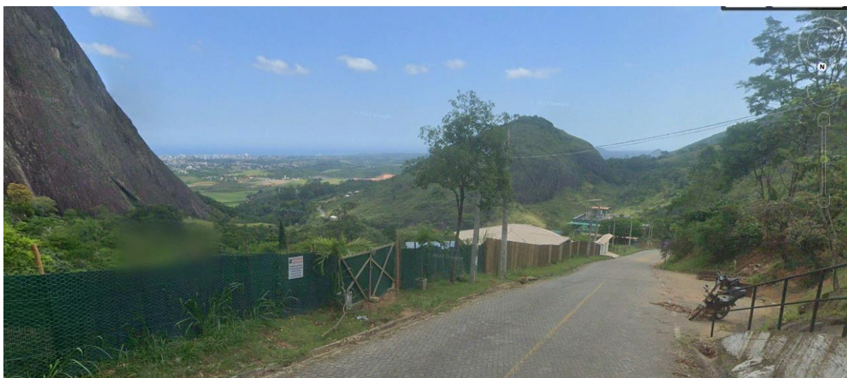
Figura 04 – LOCALIZAÇÃO DO EMPREENDIMENTO

PREFEITURA MUNICIPAL DE GUARAPARI – ES conjunto nitidamente colonial. As madeiras ficam aparentes em tons bem escuros contrastando com a alvenaria de cor branca e as estruturas em arco de pedra aparente. Aproveitando a localização única e privilegiada, o pórtico servira também como mirante para os visitantes desta região que poderão apreciar uma vista exuberante do litoral próximo de Guarapari e vizinhanças.