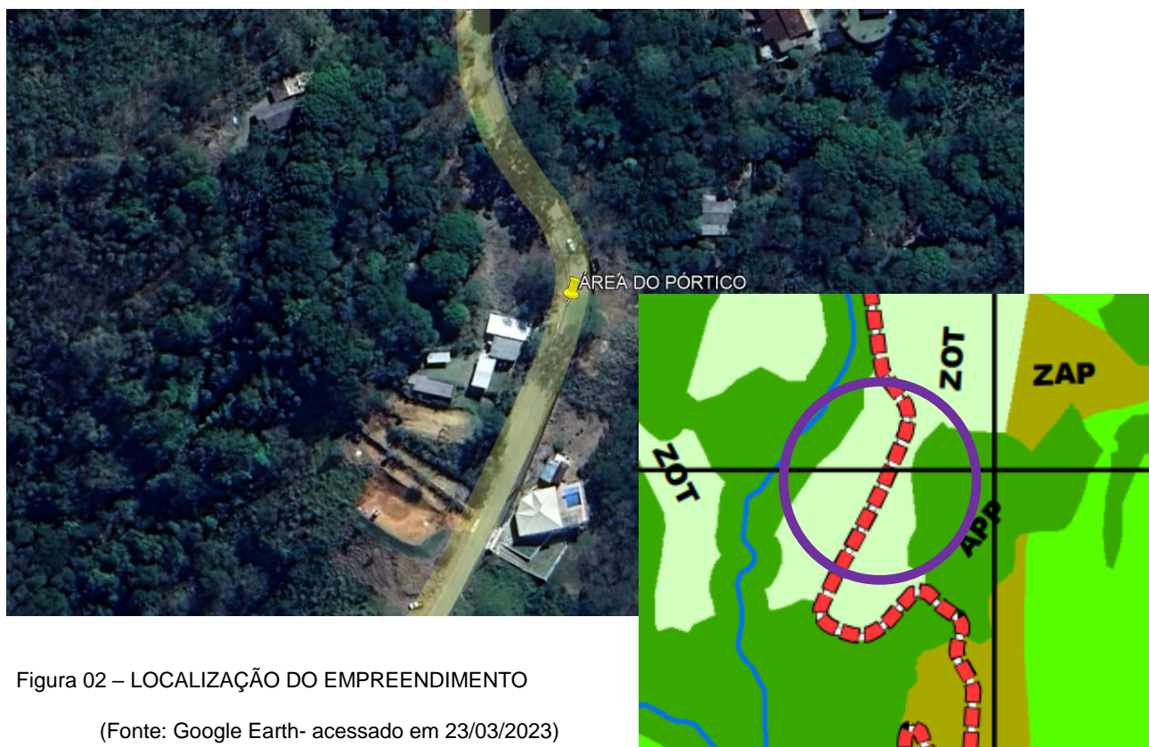
Figura 02 – LOCALIZAÇÃO DO EMPREENDIMENTO

Com tantos atrativos, criou-se um ícone de reconhecimento à cultura europeia e seus filhos, que aqui escolheram para prosperar, os imigrantes italianos, um pórtico de entrada para este lugar tão exuberante e romântico