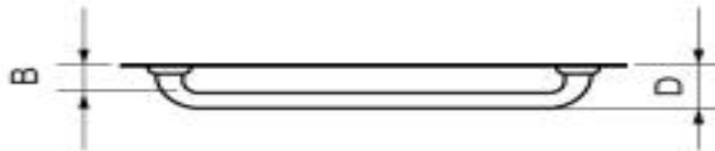
b) Vista superior

Gessyca Polastreli Sub Gerente de Controle de Material