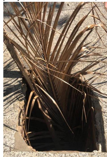
Fotos do chão/ calçadão: Bueiros que dão acesso a ligamento de água ou energia expostos e sem tampas, implantando perigo.