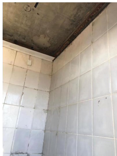
Fotos banheiro (área interna): Fotos da estrutura interna de um dos banheiros. Condições precárias. Faltando vaso, pia, torneira. Teto sem acabamento.