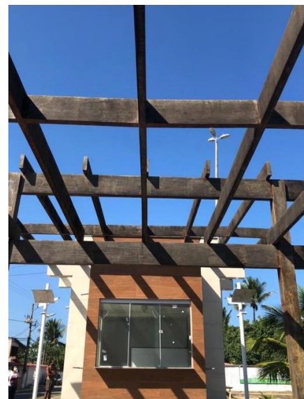
Foto Estrutura Externa: Estrutura que oferece espaço para disposição de mesas e cadeiras, área descoberta.