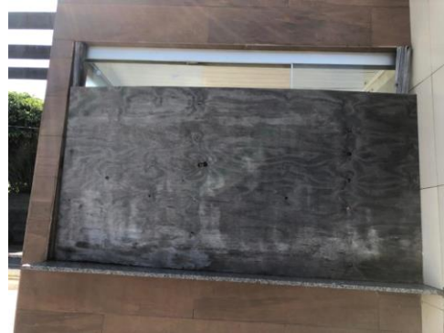
Foto Lateral: Vidro da janela de atendimento ao cliente quebrado. Coberto com tábua de madeira.