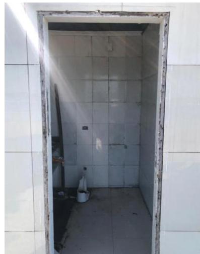
Fotos Banheiros: Um com porta de acesso danificadas e o segundo sem porta, ou qualquer proteção.