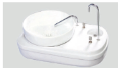
Porta copos com regulagem automática.