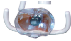
Refletor com lampada Halógena com pega mão duplo autoclaváveis e proteção tipo bolha.