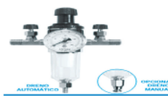
Filtro regulador de ar com drenagem automática.