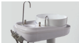
Terminais extras e kits para bomba de vácuo.