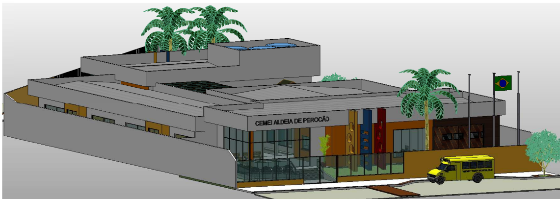
2 PERSPECTIVA ESCALA