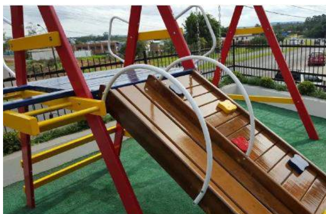
Playground mod. 01