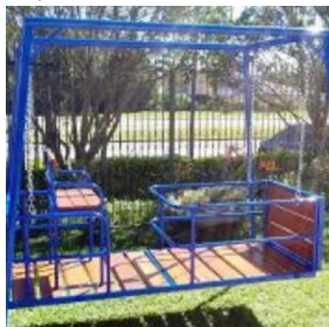
Playground mod. 02