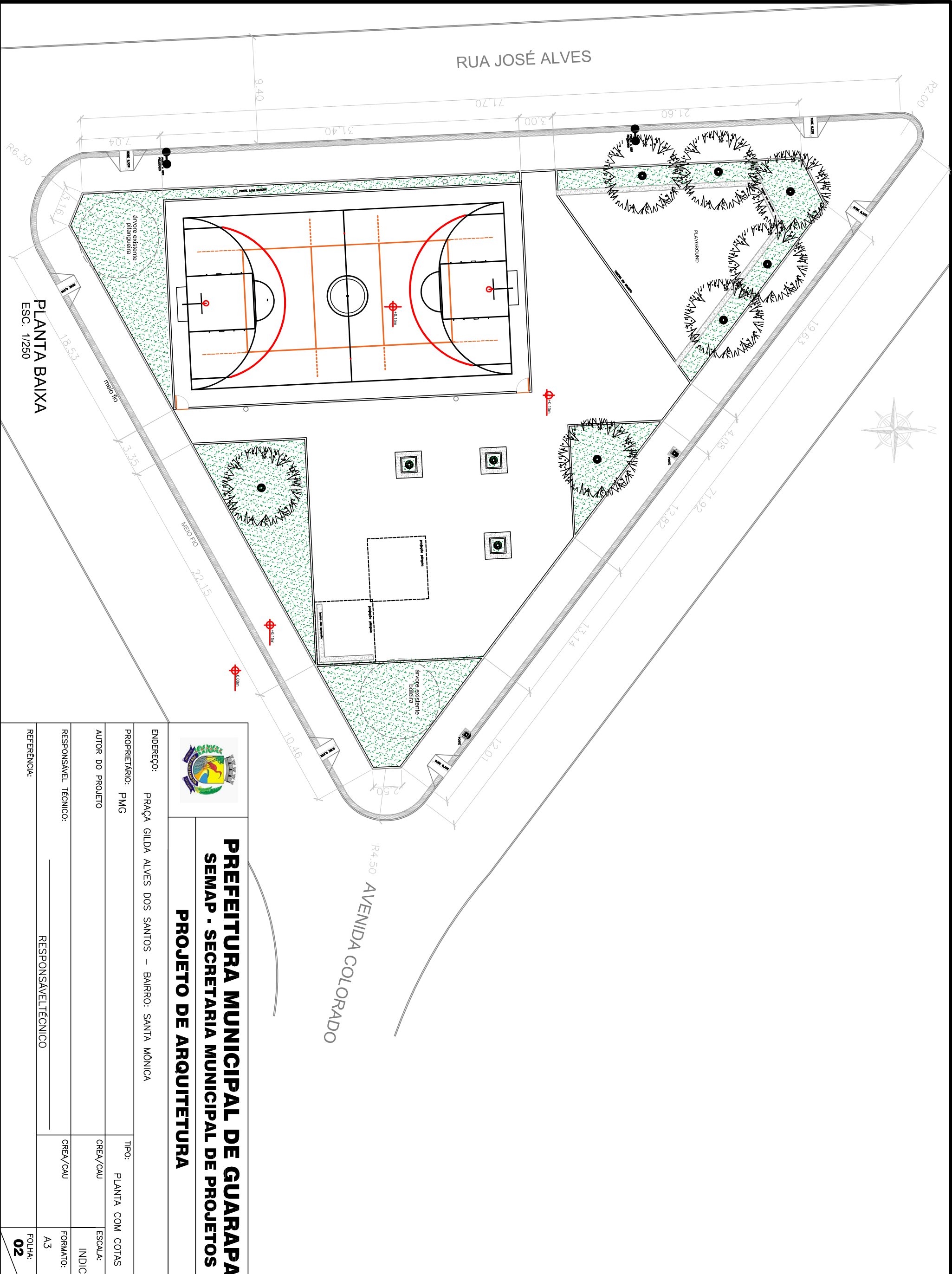
PLANTA BAIXA ESC. 1/250