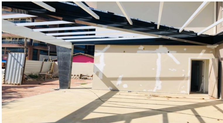
Registro Fotográfico – página 2