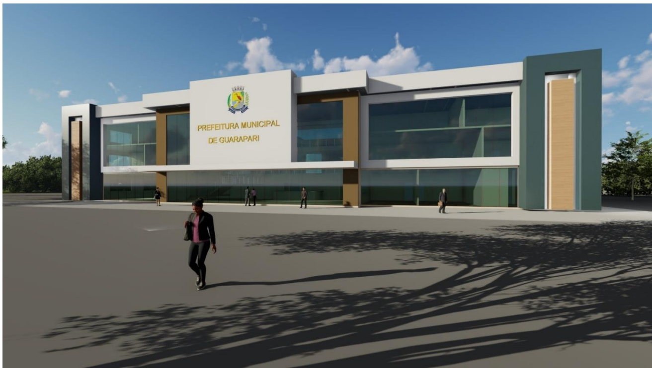
Figura 3: Vista Frontal

Trata-se de Construção em estrutura de concreto armado convencional com fundação indireta.