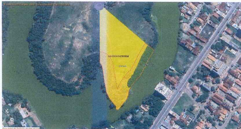
Amarelo: Área Alterada / Verde: AVN / Vermelho: APP.