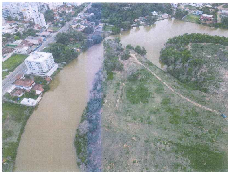
Área do empreendimento.