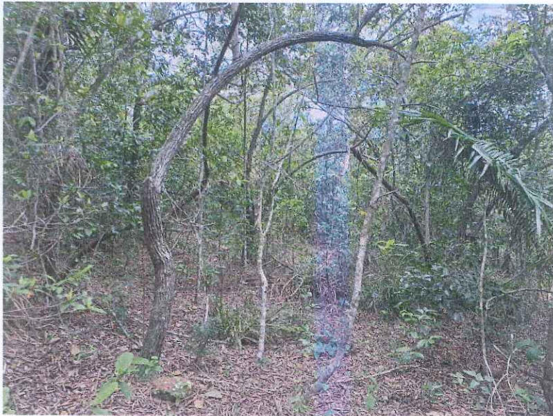
Área de Vegetação Nativa.